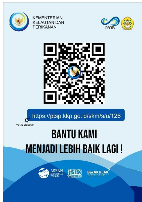
Gambar 1. Link dan Barcode SKM